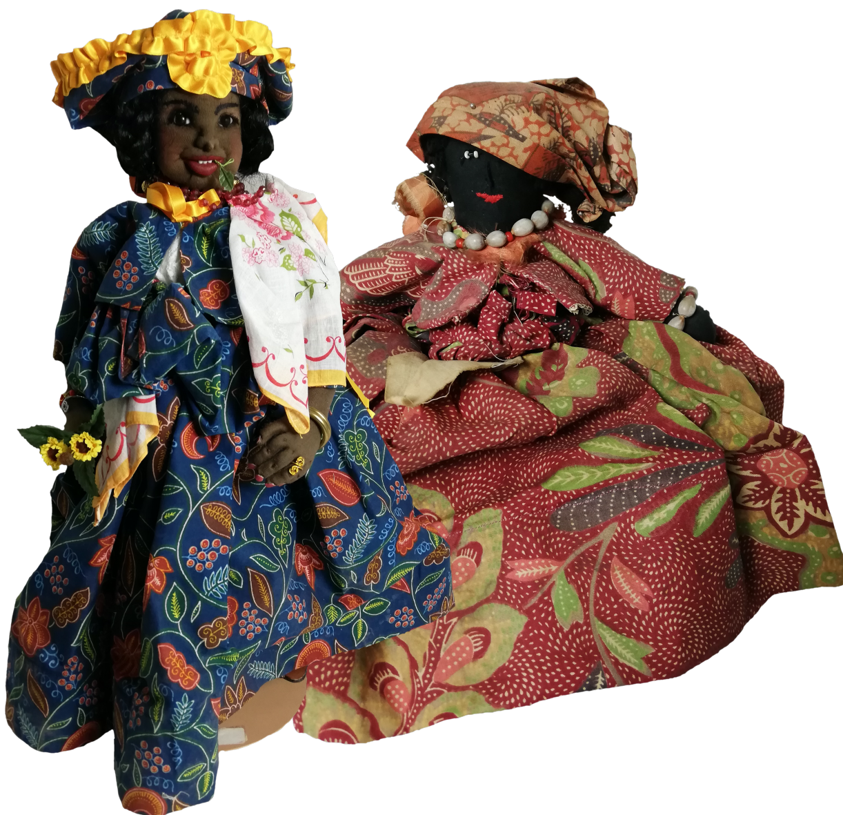
De 2 gebruikte poppen bij emotienetwerken.

Zonder verdere context werden deze poppen door de studenten met argwaan bekeken. Ze werden ontvangen als ouderwetse uitbeeldingen van racistische karikaturen van Surinaamse vrouwen. Pas na uitleg over wie ze maakte, waarom ze ze maakte en hoe deze gebruikt werden, schoot de waardering omhoog. Een groot deel van de deelnemers vindt achteraf dat de collectie zichtbaar moet worden en dat het verhaal van Rita verteld moet blijven.