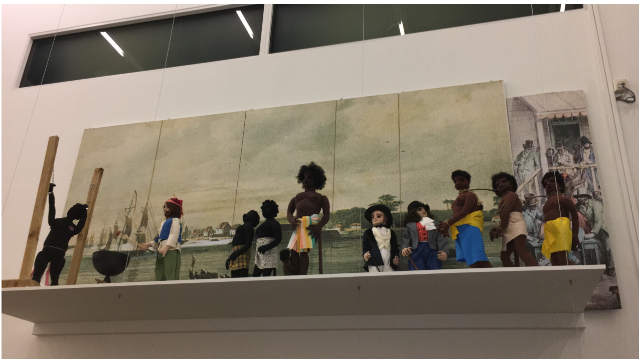
Diorama Slavenhandel in tentoonstelling Museum van Nederland Kunsthall Rotterdam 2021

In 2020 zijn 2 diorama's en een deel van de textielcollectie gebruikt voor presentaties. Hiermee werd duidelijk dat het gebruik van papieren labels (zoals op dit moment gebeurt) niet duurzaam is. Deze raken snel kwijt en bij het opruimen en opnieuw inpakken van de stukken is niet altijd gehouden aan de inventarisstructuur als vooraf vastgesteld. Er moet beter nagedacht worden over hoe dit in de toekomst te verbeteren.