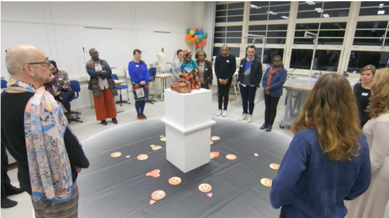
Aftrap gesprek modeprofessionals - 5 maart 2020

Staphorster streekdrachtmotieven in sommige koto's en angisa's. De manier waarop sommige koto's in elkaar gezet zijn, wordt niet door iedereen erkent als een officiële koto. Het wijkt (te veel) af van de traditie.